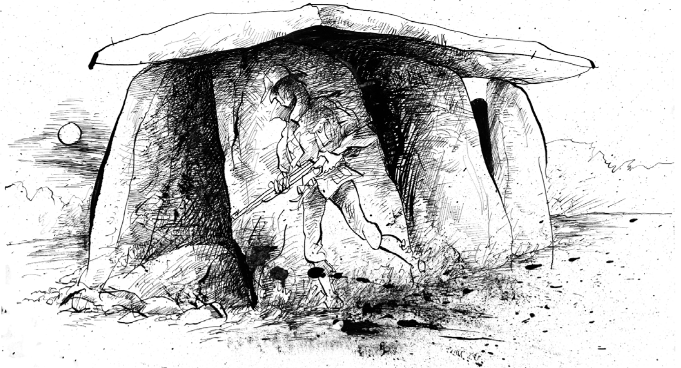
Jour 6 : Il traquait le mal absolu... (en kiosque le 15 juin, La Vendetta de Sherlock Holmes )