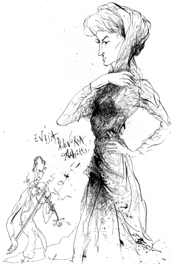
Jour 4 : A Evisa, il a rencontré l'amour ! (en kiosque dès le 15 juin)