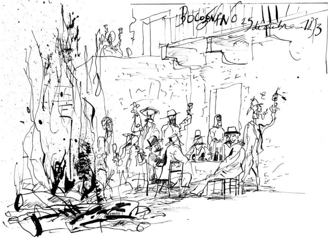
Jour 3 : Il a bu le verre de l'amitié à Bocognano... (en kiosque dès le 15 juin)