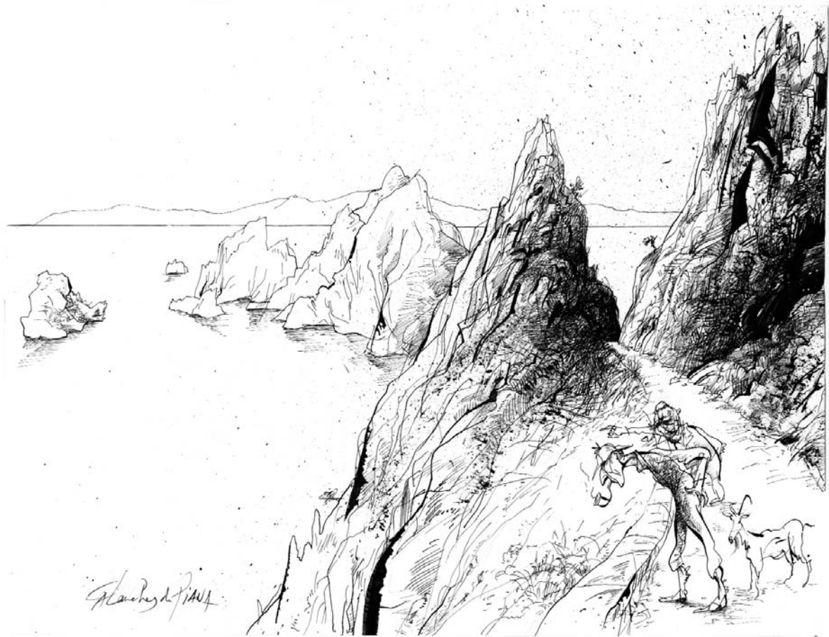
Jour 5 : Il a parcouru la Corse entière... (en kiosque le 15 juin, La Vendetta de Sherlock Holmes )